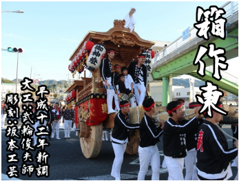
【箱作東】平成 12 年大工:武輪建設、彫刻:坂本工芸によって新調。今年、下荘地区の宮当番として下荘地区のやぐらが菅原神社へ宮入りする。(下荘地区)