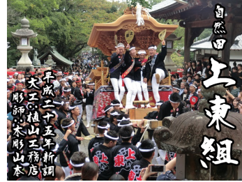
【自然田上東組】平成 25 年大工:植山工務店、彫師:木影山山本によって新調。小字で芝出とも呼ばれている。(東鳥取五地区)