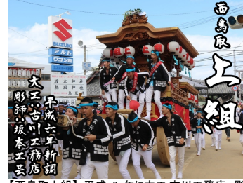
【西鳥取上組】平成 6 年に大工:古川工務店、彫師:坂本工芸によって新調。現在パレードへ不参加。(西鳥取地区)