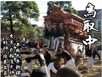
【鳥取中】平成 9 年大工:武輪建設、彫師:坂本工芸によって新調。昔は中と称していましたが明治 17 年に鳥取中と改称、しかし今でも中村と呼ばれています。(東鳥取四地区)