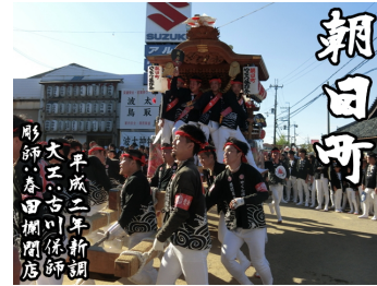
【朝日町】平成 2 年大工:古川保師、彫師:春田欄間店によって新調。阪南市で唯一、吹き散りを付けています。(尾崎地区)