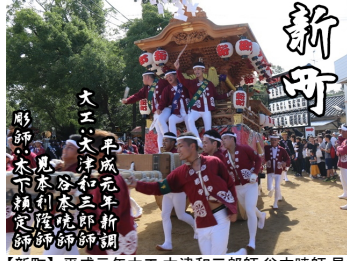
【新町】平成元年大工:大津和三郎師、谷本暁師、見本利隆師、彫師:木下頼定師によって新調。令和 3 年、大工:泉谷工務店、彫師:木影前田工房によって新調予定。(西鳥取地区)