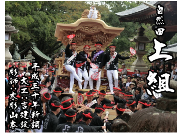
【自然田上組】平成 30 年大工:吉建設、彫師:木彫山本によって新調。昨年新調したばかりのやぐらです。(東鳥取五地区)