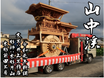
【山中溪】令和元大工:井上工務店、彫師:木影山山木彫前田工房によって新調。本年 8 月 25 日に新調入魂式を行ったばかりの一番新しいやぐら。(東鳥取五地区)