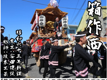
【箱作西】昭和 63 年大工:安田建設、彫師:坂本工芸によって新調。宮入りは地元の加茂神社へ宮入りする。(下荘地区)