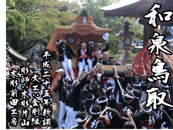
【和泉鳥取】平成 25 年大工:金剛組、彫師:木影山山木彫前田工房によって新調。旧東鳥取町時代まで新家と言う地名だった。(東鳥取五地区)