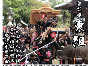
【自然田東組】大工:植山工務店、彫師:木影岸田によって新調。小字で中之場とも呼ばれている。(東鳥取五地区)