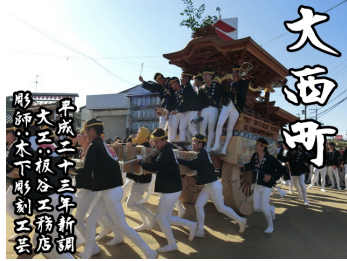
【大西町】平成 23 年大工:板谷工務店、彫師:木下彫刻工芸によって新調。板谷工務店の出世やぐらである。(尾崎地区)